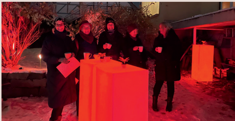
Ein stimmungsvolles Ambiente: Lebendiger Adventskalender am 4.12.2023 in der Baunsbergstr. 43